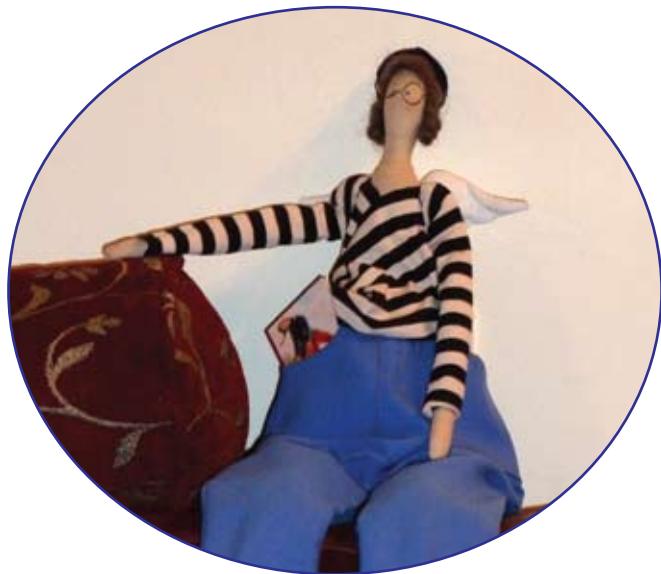
«Редактор Надя». Подарок издательства ЭКСМО. Сделана к выходу книги «Синдром Петрушки» "Editor Nadia". The gift of EKSMO publishers. Made to the book's "Syndrome Petrushka"

Все это было столь органично моему ожиданию Испании, что просто слилось в душевный молчаливый трепет, в проглоченные слезы, в небесную паванну – когда ты точно знаешь, что вот эти семь минут, впечатанных в бледное небо готической Барселоны, отныне и навсегда станут потаенным талисманом твоей единственной, замусоренной, не самой удачной, не самой прекрасной жизни...»