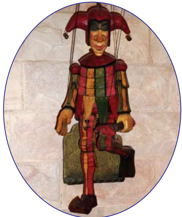
«Пражанин Кашпарек». Участвует в романе «Синдром Петрушки» (Помогал его писать) "Kashparek". The Participates in the novel "Syndrome of Petrushka" (He helped write it)

Насчет рубежа цен... Ну послушайте, рубеж существует у каждого человека, причем колеблется в зависимости и от наличности, и от намерений, и от момента, и даже от настроения. Но бывали и случаи, когда я выкладывала очень приличные деньги. Например, года три назад, в Питере. Мы должны уже были уезжать, а у меня оставалась довольно большая сумма в рублях. Мы искали обменный пункт – поменять на доллары, и вдруг в витрине галереи я увидела летящего на меня Белого Ангела. Я вошла и купила его, потому что он стоил ровно столько, сколько было у нас денег. Меня поразило совпадение и то, что он дождался меня. Сейчас парит над