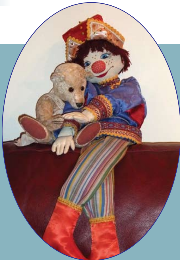
«Ванечка и Пантюша» “Vanya and Pantyusha”

Who was and is your favorite character in this book?