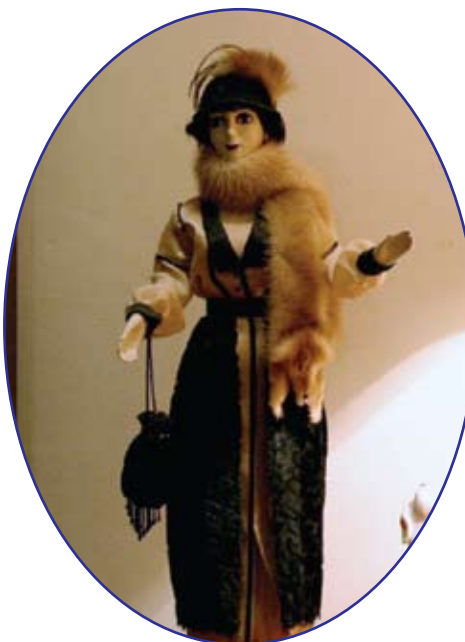
Кукла «Фанни» The Doll "Fanny"

Do you have favorite artists and works? Do you follow the doll world in general?