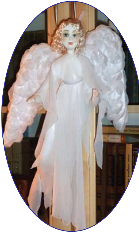
«Петербургский Ангел Белый» "Petersburg's White Angel"

As for prices... Well, listen, the border exists, and varies depending on the cash and the intention. And on the moment, and on the mood. But there were also times when I paid very decent money. For example, three years ago, in St. Petersburg... We were about to leave, and I still had some fair amount of rubles. We were looking for currency exchange – to change to dollars. And then in the window gallery I saw a White Angel flying at me. I came in and bought it because it cost just as much as I had. I was struck by the coincidence